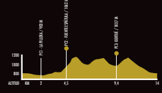
4ª NORTE DE GUARA (13,5 KM - 660 M)