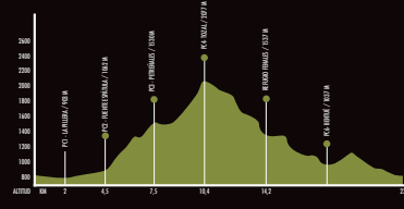
13ª SUBIDA AL TOZAL DE GUARA (22,5 KM - 1.585 M)